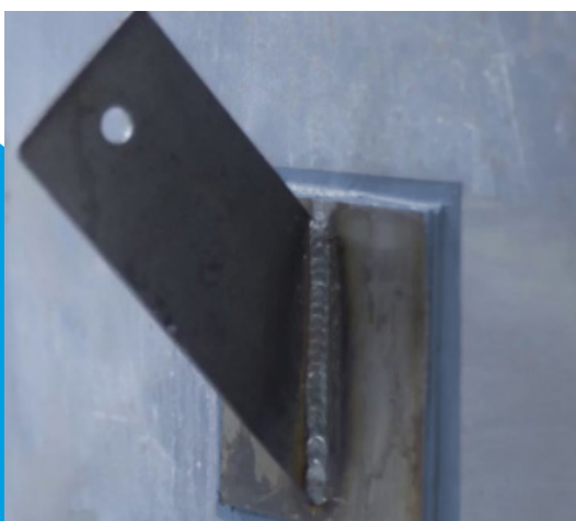
Belzona 7311 – zespojony uchwyt ze ścianą zbiornika