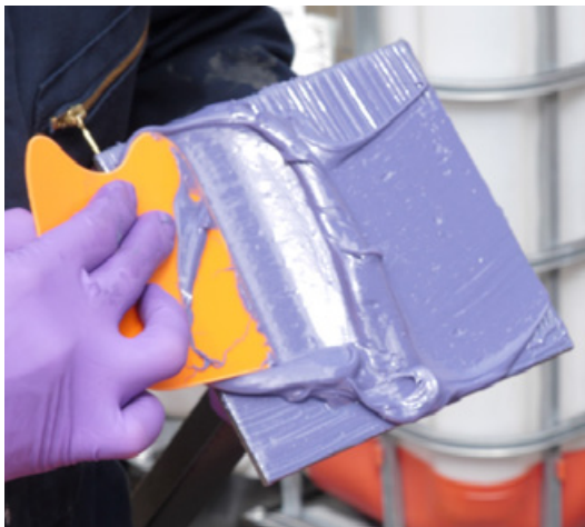
Aplikacja z naddadkiem Belzona 7311 na podstawę (łapę) wspornika