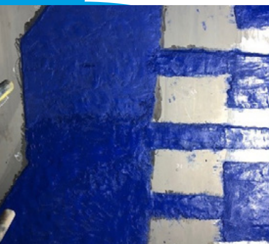
Silos na popiół Belzona 1818