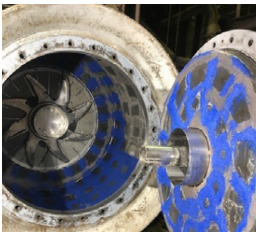
Turboseparator w zakładzie recyklingu Belzona 1818