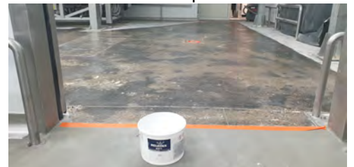
aktywacja podłoża materiałem Belzona 4911